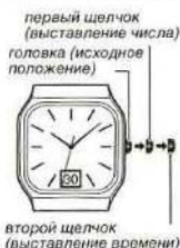
первый щелчок (выставление числа)