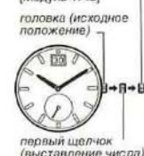
первый щелчок (выставление числа)