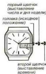
первый щелчок (выставление числа и дня недели)